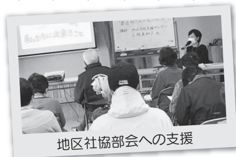
地区社協部会への支援