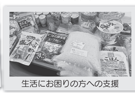
生活にお困りの方への支援