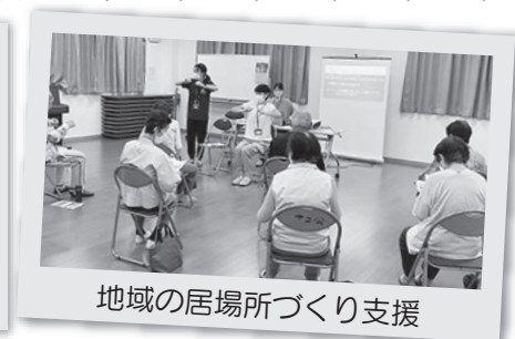
地域の居場所づくり支援