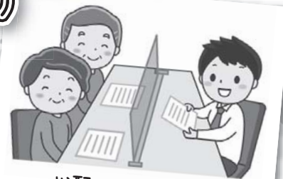
心配ごと相談開催