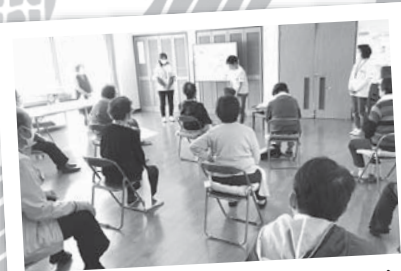
地区社協部会(通いの場など)

二宮町議会、二宮町地区長連絡協議会、二宮町部長会、二宮町課長会、二宮町ゆめクラブコーラスカナリア、朝日新聞二宮専売所、(株)カトー二宮営業所、二宮胃腸内科クリニック、中南信用金庫中里支店、山本耳鼻いんこう科クリニック、井上整形外科、(社福)寿考会みちる愛児園中里ナーサリー、(株)桑野電機製作所、野原落花生店、みのしま歯科クリニック、ぽっかぽか二宮