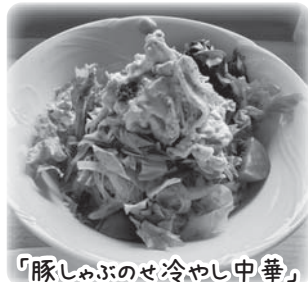
「豚しゃぶのせ冷やし中華」

「ともしびショップ」は、障がい者の就労支援のためのお店で、「なのはな」では軽食や喫茶ができます。日替わりランチ(600円)をはじめ、季節限定のメニュー等も提供しています。 ご来店お待ちしております。