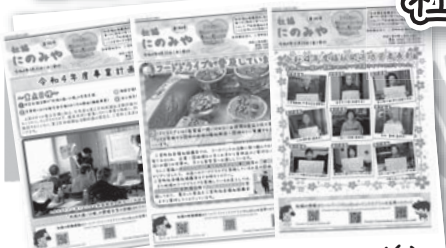
社協にのみや発行(広報紙)