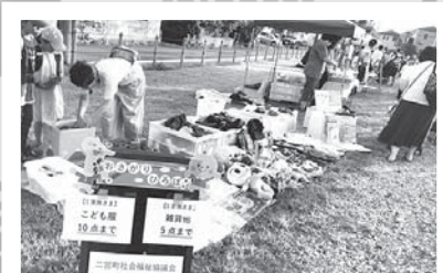
子育て支援(おさがり広場など)