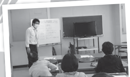
ボランティアセンターの運営