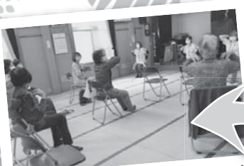
地区社協部会(通いの場など)