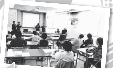
ボランティア入門講座