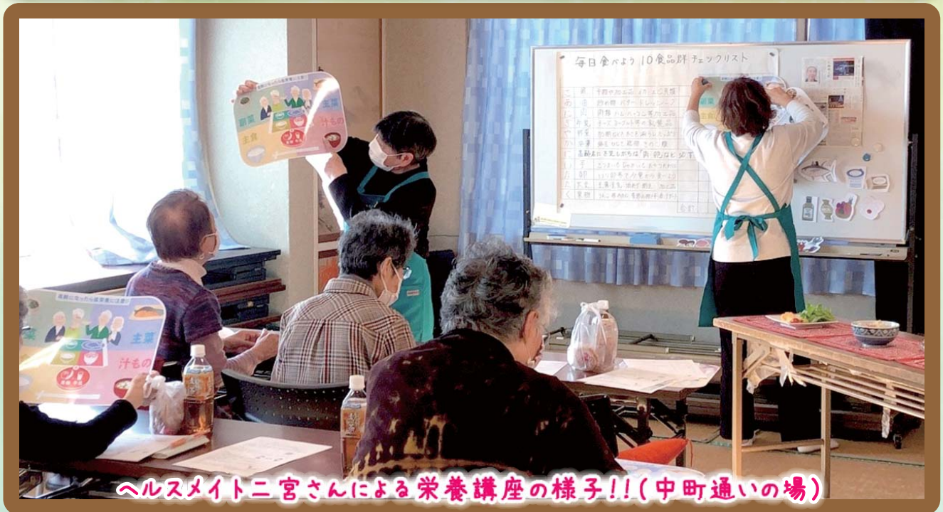
ヘルスマイトニ宮さんによる栄養講座の様子!!(中町通いの場)

上記の4つの重点目標に加え、今年度は第2次地域福祉活動計画の最終年度にあたることから、ウイズコロナの下、感染状況に留意しながら事業を推進し、計画の進捗状況を総括するとともに、第3次地域福祉活動計画の策定を、二宮町と足並みをそろえて進めていきます。