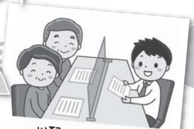
心配ごと相談開催