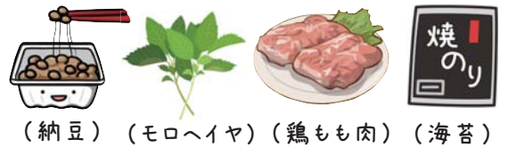
(納豆) (モロヘイヤ) (鶏もも肉) (海苔)