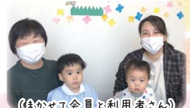
(まかせて会員と利用者さん)

町内在住で健康で育児に熱意があり、ご自宅での 預かりが可能な20歳以上の方を募集します。 受講希望者が集まり次第日程調整の上、開催日時 を決定いたします。下記連絡先へお申込みください。