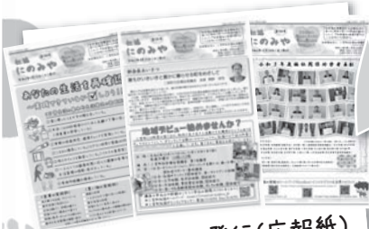
社協にのみや発行(広報紙)