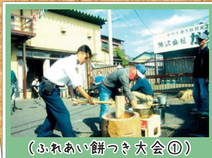
(ふれあい餅つき大会①)