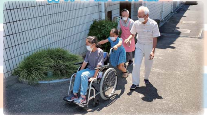
(写真:車いす体験の様子)

夏休み福祉体験を実施しました。 参加者数は2名でした。当日は車いす体 験やボッチャ体験、認知症サポーター養成 講座を実施しました。