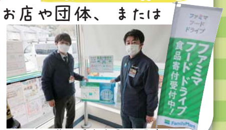
(ファミリーマート釜野橋店 店長様(写真右))

また地域のフードドライブを実施しているお店としては、ファミリーマート釜野橋店様でファミマフードドライブを実施しており、集まった食品を二宮町社会福祉協議会までご寄付してくださっています。