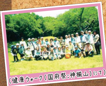
(健康ウォーク(国府祭:神揃山)にて)

夏休み期間での「子ども会とのふれあい大会」がコロナ禍で今年も中止となりました。残り秋口のイベントとして「健康ウォーク・餅つき大会」の予定があり、コロナ禍の心配はありますが、ぜひ開催できるよう祈るばかりの昨今です!!