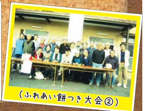
(ふれあい餅つき大会②)