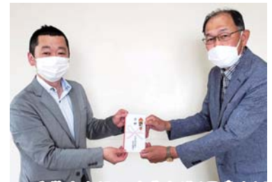
【西湘地域労働者福祉協議会様(写真左)】

匿名 -----衣類4着 〃 -----ショッピングカート1台 〃 -----大人用おむつ7袋