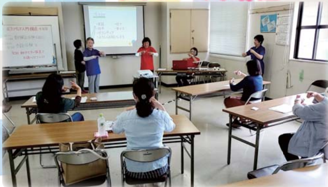
(写真:手話体験の様子)

5～6月にかけて、第10回ボランティア 入門講座を実施しました。参加者数は 3名でした。