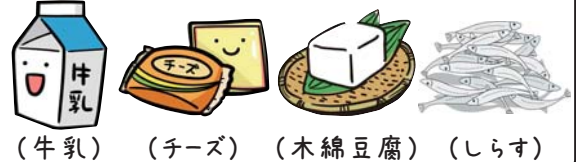
(牛乳) (チーズ) (木綿豆腐) (しらす)