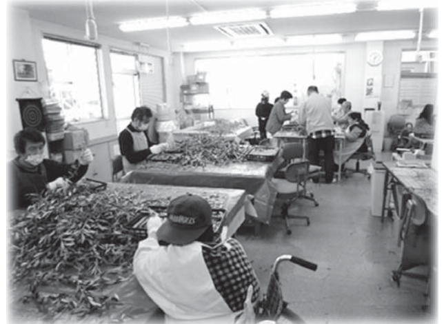
【オリーブ茶葉摘み取りの様子】

普段は電機部品やボールペンの組立、サンプル品の封入等、受託加工の作業ですが、オリーブ茶葉の摘み取りは、農業と福祉、いわゆる農福連携の取り組みと言えます。