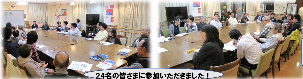
24名の皆さまに参加いただきました！