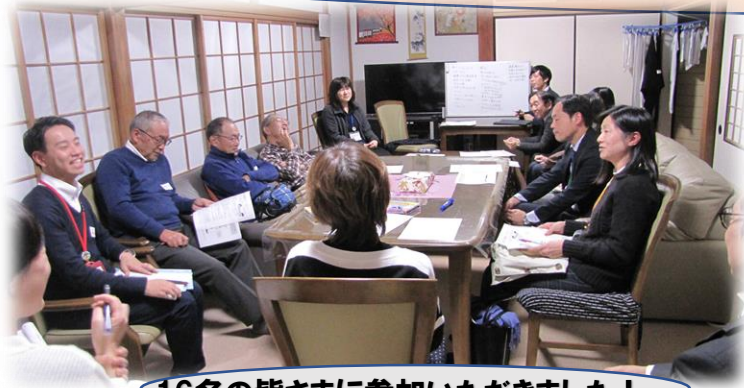
16名の皆さまに参加いただきました！

12月10日デイサービスぽっかぽか二宮にて 二宮小区地域の協議体立ち上げに向けた話し合いを行いました。 第一歩としてお互いを知ることから始めよう！ 自己紹介と今気になっていることを話していただきました。 参加者個々の活動の話も聞けました。立上げにはもう少し時間がかかりますが、2回目を2月22日に開催します。